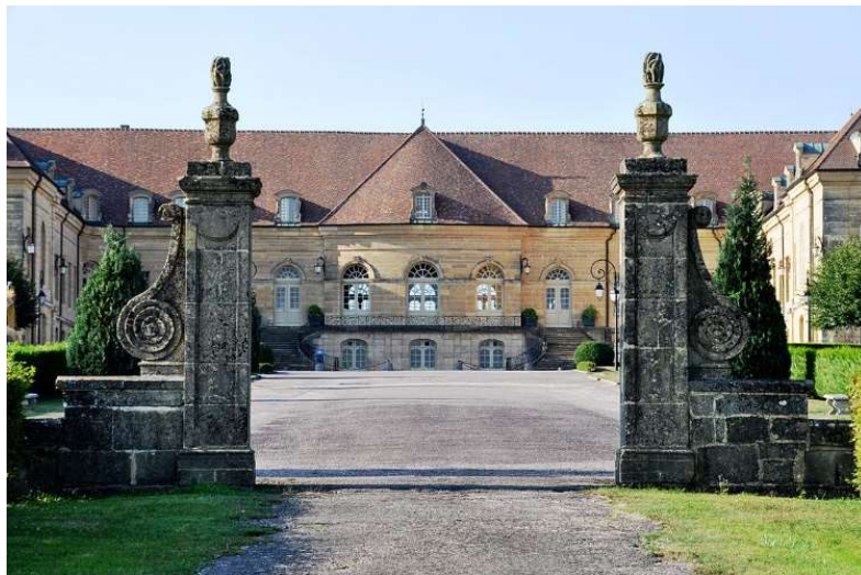
Entrada al castillo de Saint-Remy (Franco Condado)