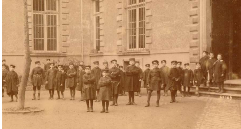
Alumnos en la Institución Santa María. Rue Mirail (Burdeos)