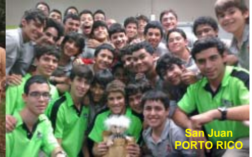
San Juan PORTO RICO