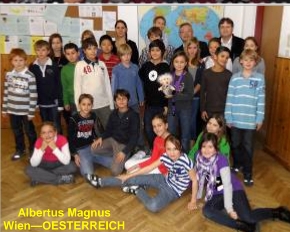
Albertus Magnus Wien—OESTERREICH