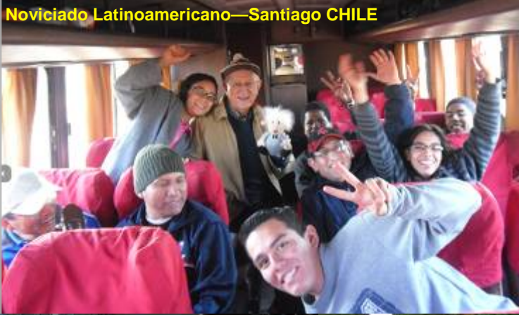
Noviciado Latinoamericano—Santiago CHILE