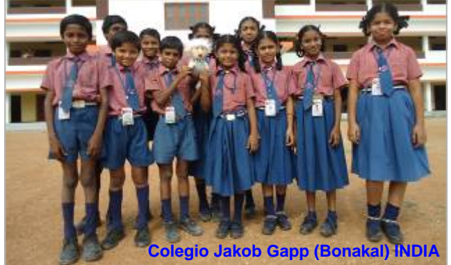
Colegio Jakob Gapp (Bonakal) INDIA