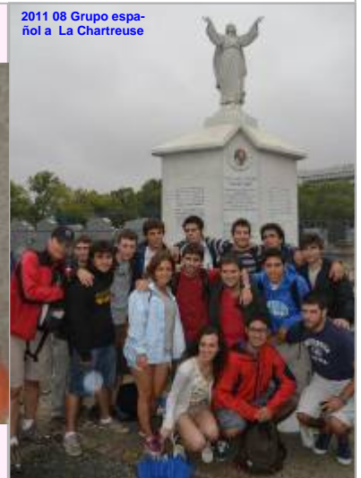
2011 08 — Mussidan — Rue des Frères Chaminade